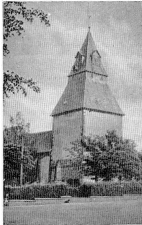
Turm der Kirche

äußeren Erneuerung der ganzen Kirche wurde der alte Verputz am Turm abgekratzt. Dabei kamen die jetzt zu sehenden herrlichen Rundbogengesimse um die drei Seiten des Turmes zum Vorschein, ebenso das Quadersteingefüge an den Ecken des Turmes. Dasselbe Aussehen zeigte der Turm bereits früher, vor 1781, schon einmal. Damals wurde alles mit Mörtel bedeckt.