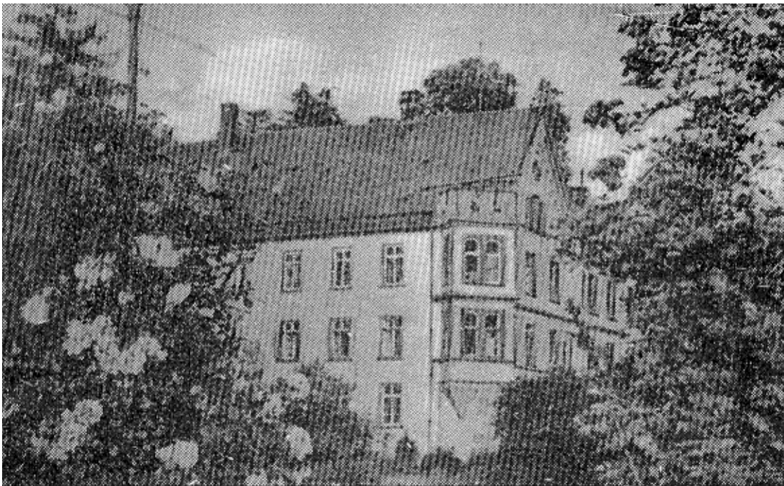
Schloß zu Großen-Buseck

Das heutige Schloß zu Großen-Buseck ist auf den Mauern einer ehemaligen Burg aufgebaut, die in vielen Urkunden unter dem Namen „der Perch“ erscheint (erstmalig 1466). Es war eine Burg der Herren v. Trohe. Ueber die Zeit ihrer Erbauung läßt sich nichts Genaueres sagen. Bestimmt hat sie schon 1355 (Lehensurkunde von 1355: „... von dem huyse zu Buchesecke . . .“), wahrscheinlich aber schon 1233 bestanden.