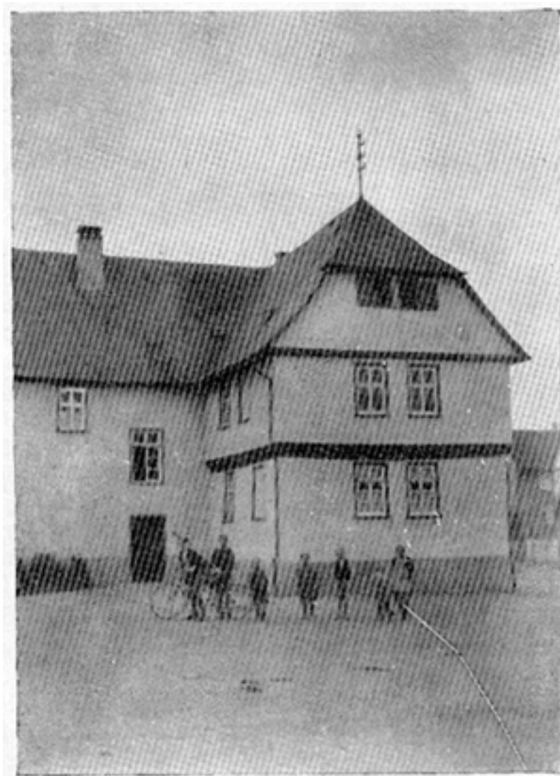
Schulhaus von 1834 bis 1922