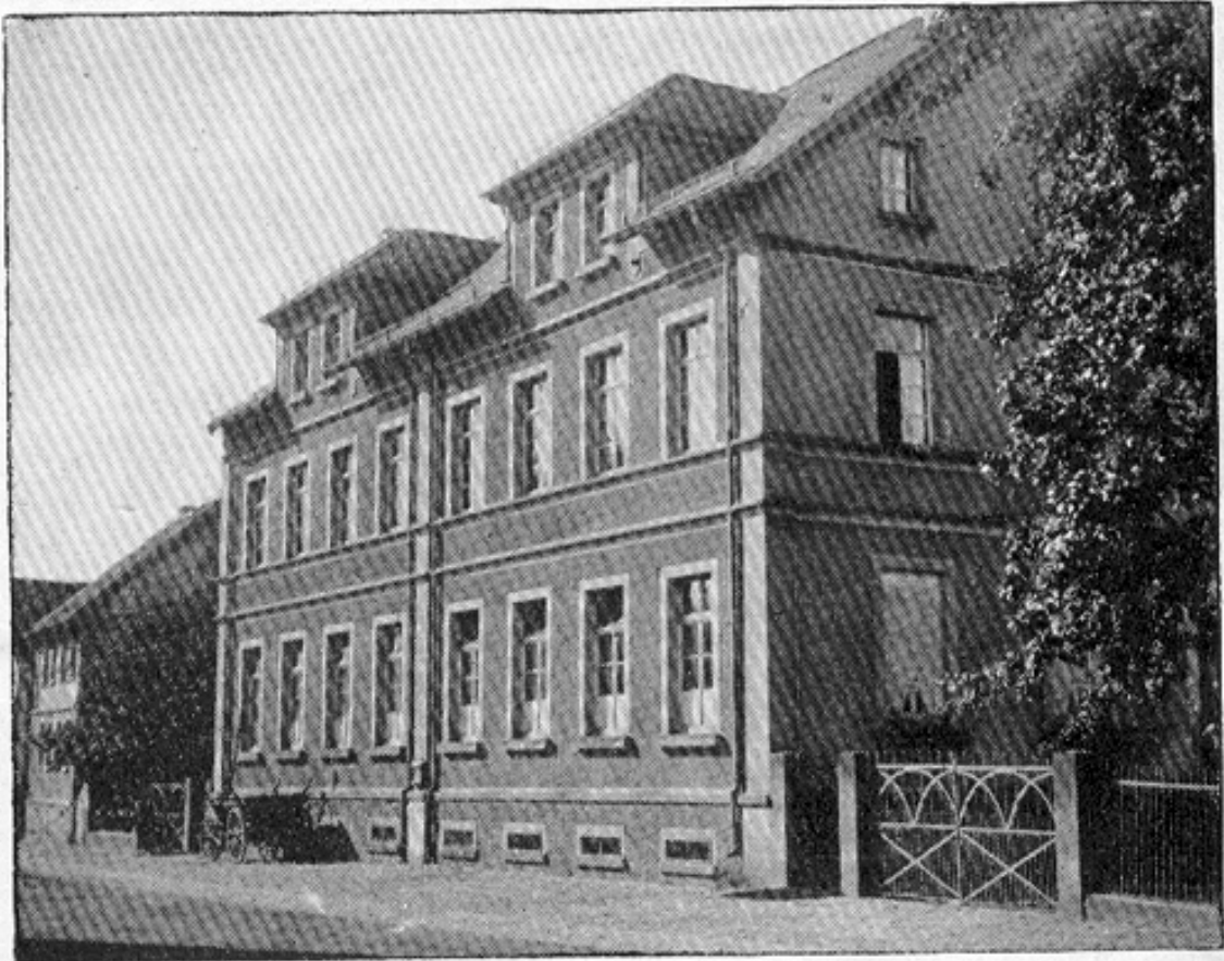
Schulhaus an der Oberpforte

damentierung kostete auf dem sehr wasserreichen Gelände „viel Arbeit und enormes Geld“. Bis zum Beginn des Winters wurde der Bau jedoch noch glücklich unter Dach gebracht und im Sommer 1878 fertiggestellt, die innere Einrichtung vollendet und auch die Doppelscheuer mit Stallungen hinzugefügt. Für letztere betrug der Voranschlag 5846,25 Mk.; beide Voranschläge wurden jedoch um einige tausend Mark überschritten, was wohl in dem „wasserreichen“ Ge-