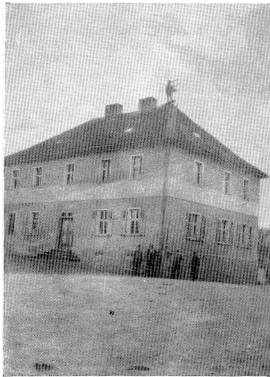
Pfarrhaus vor dem Umbau (Ansicht vom Anger)

1932 begann man mit dem inneren Ausbau und im August konnte der neuernannte Pfarrer Müller seinen Einzug halten. - Durch Umbau und bessere Raumausnutzung im Innern des Hauses hat man die verlorengelassene Wohnfläche ersetzt und die Wohnung zweckmäßiger und freundlicher gestaltet. Das umgebaute Pfarr-